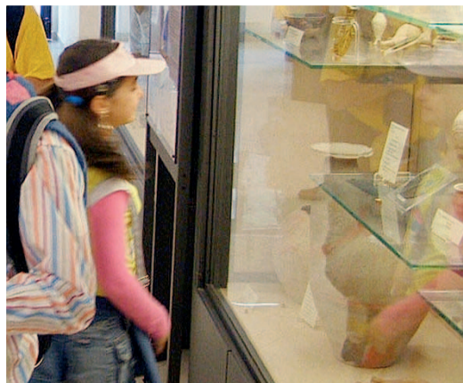
LA STORIA BISTRATTATA Il sito archeologico di Canne della Battaglia e l'antiquarium